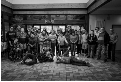
Foto-Projekt mit Dr. Ausbüttel

Im Januar 2024 wurde gemeinsam mit der Firma Dr. Ausbüttel ein besonderes Fotoprojekt umgesetzt. Ein professioneller Fotograf porträtierte Beschäftigte aus Werkstätten für Menschen mit Unterstützungsbedarf, darunter auch Teilnehmende der SoVD-Lebenshilfe Witten.